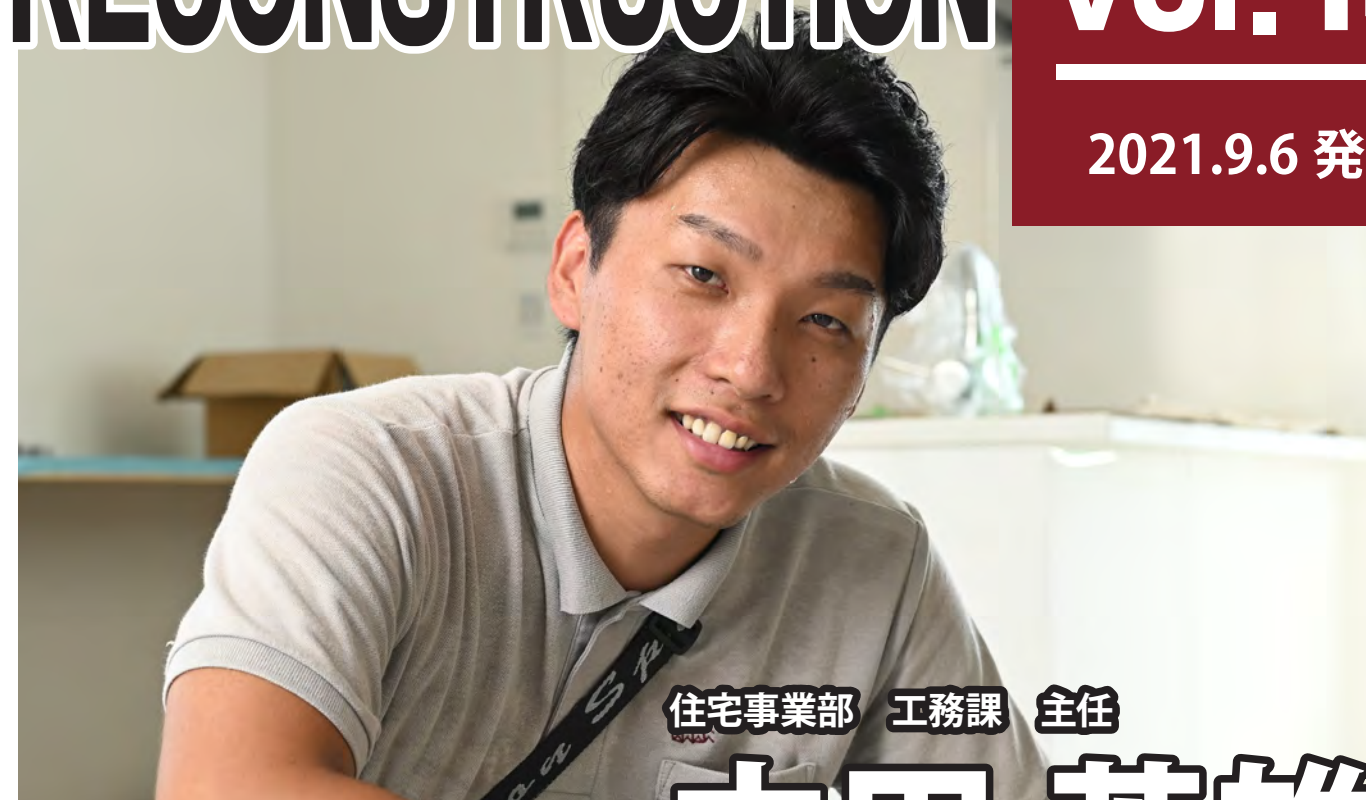
住宅事業部 工務課 主任