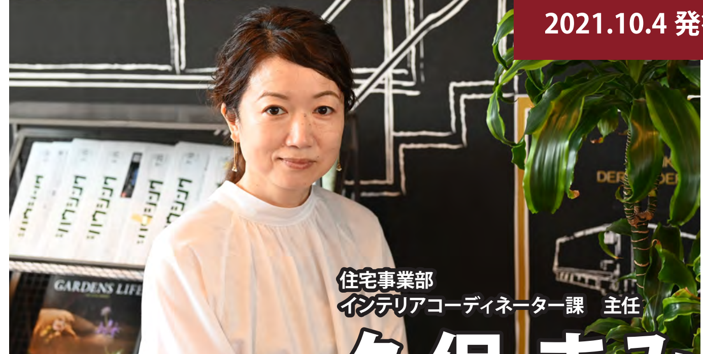
住宅事業部 インテリアコーディネーター課 主任