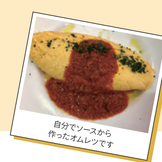
自分でソースから作ったオムレツです