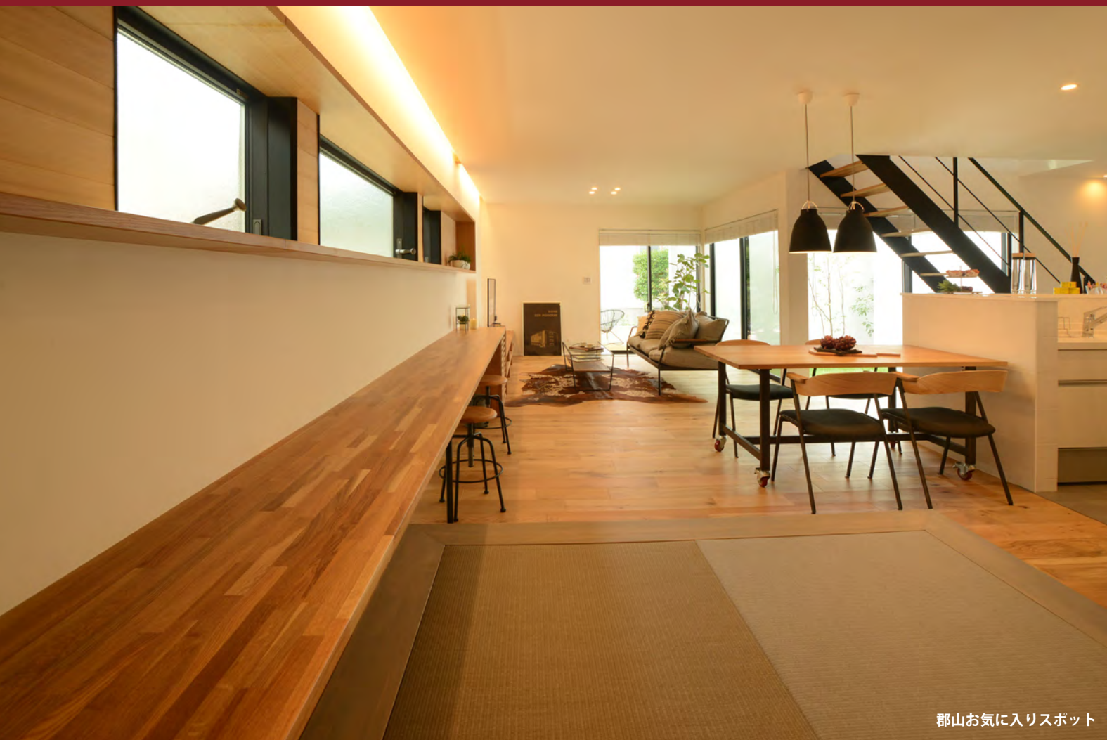
郡山お気に入りスポット

LDKの内装は、扉がハイドアという天井までドアを配置する構造となっており、これによって広がりのある印象を受ける工夫がなされています。また、天然無垢の木材を使用することで自然の風合となりました。全体として、温かみを感じていただける、心地のいい空間が広がっています。