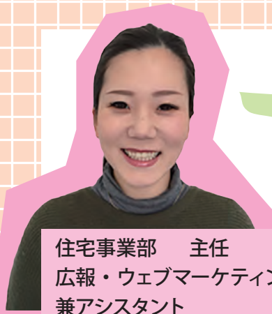
住宅事業部 主任 広報・ウェブマーケティング 兼アシスタント