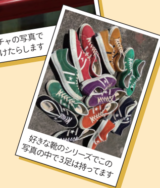
好きな靴のシリーズでこの写真の中で3足は持っています