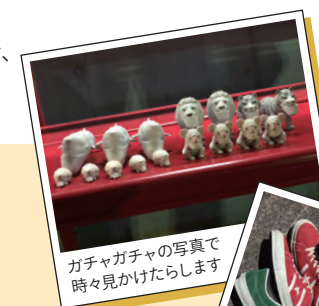
ガチャガチャの写真で時々見かけられます