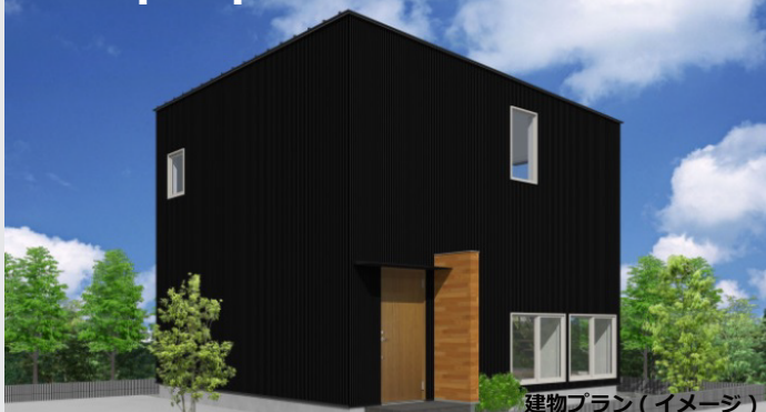
建物プラン（イメージ）

■1階法定床面積：約49.68㎡（約15.03坪）■2階法定床面積：約44.71㎡（約13.52坪） ■法定延床面積：約94.39㎡（約28.55坪）■建築面積：約49.68㎡（約15.05坪）■UA 値0.51W/㎡・K