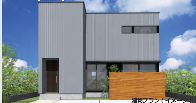
建物プラン（イメージ）

■1階法定床面積：約 52.17㎡（約 15.78坪）■2階法定床面積：約 38.92㎡（約 11.77坪） ■法定延床面積：約 91.09㎡（約 27.55坪）■建築面積：約 53.41㎡（約 16.16坪）■UA 値 0.52W/㎡・K